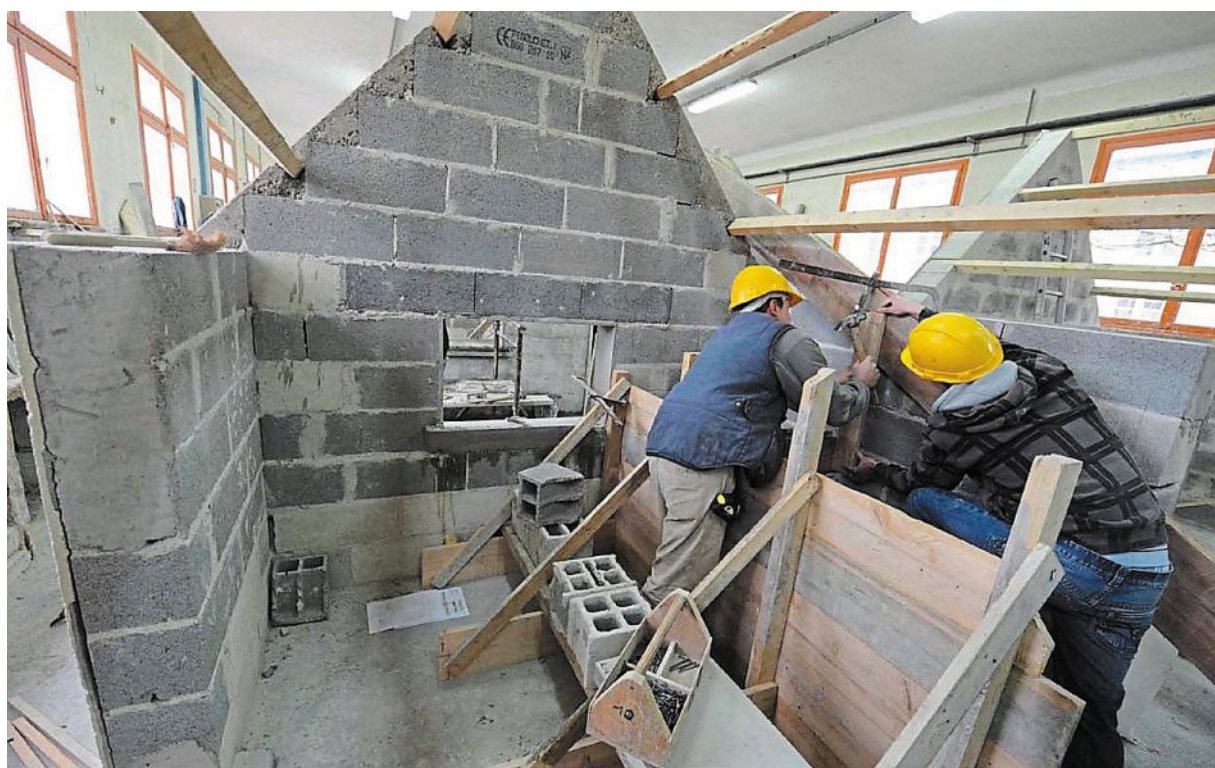
En Bretagne, près de la moitié des entreprises artisanales travaillent dans le secteur du bâtiment.

Par secteur d'activité, les entreprises artisanales les plus nombreuses se trouvent dans le secteur du bâtiment (40 %), suivi des services (31 %), de l'alimentation (15 %) et de la production (14 %). Une répartition qui reste stable au fil des années, et que l'on